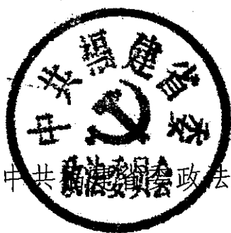
中共福建省委纪律检查委员会