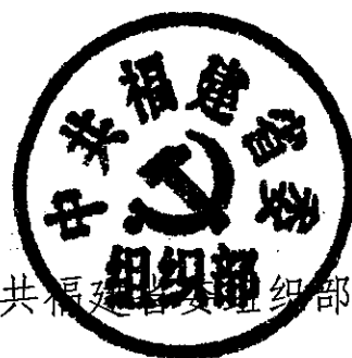
中共福建省委组织部