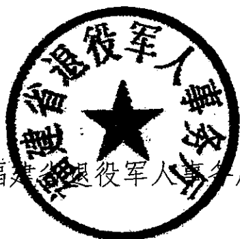
福建省退役军人事务厅